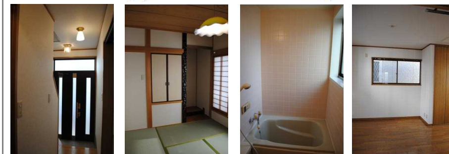
※間取り図面は概略図に付き、一部現況と異なる場合がございます