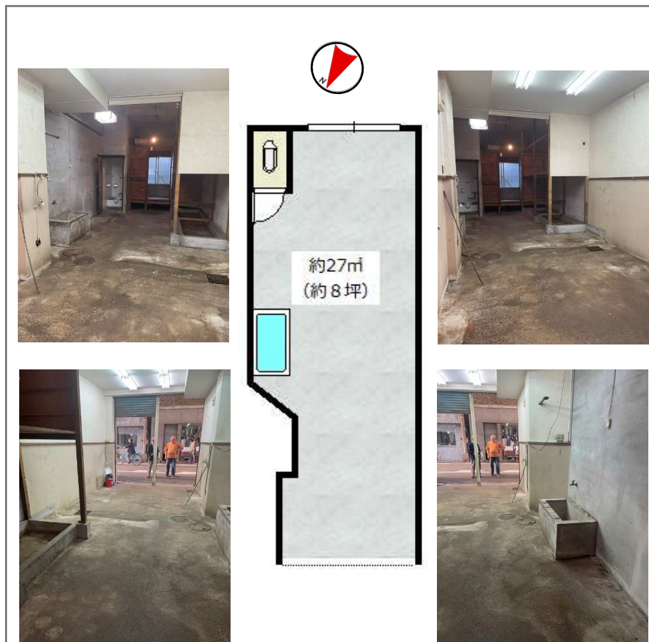
※間取り図面は概略図に付き、一部現況と異なる場合がございます。